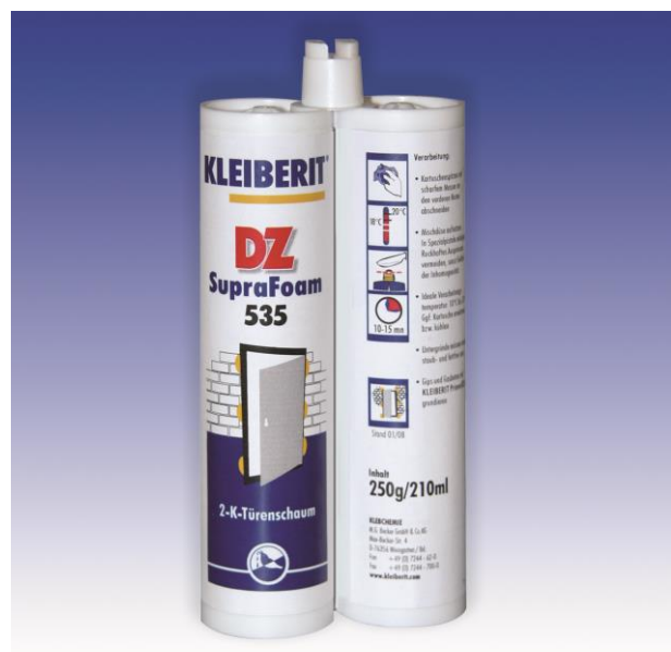
SupraFoam DZ u duploj kartuši

nakon jednog minuta lepak vise nelepi mogućnost sećenja: nakon 3 - 5 minuta demontaža: nakon oko 20 minuta istvrdnavanje: nakon 15-20 minuta kod 20° C (kod nižih temperatura mnogo duže ) struktura ćelije: srednjo-tvrda, pretežno otvorenih ćelija postupak požara: B 2 nach DIN 4102