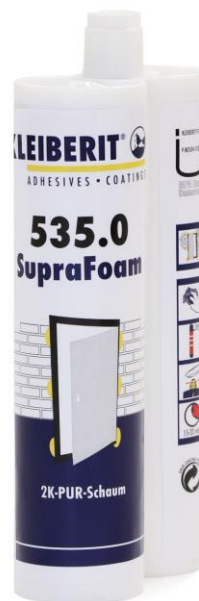
Клейберит 535 в двойной картуше