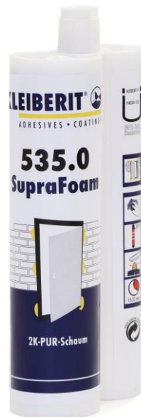
KLEIBERIT 535.0 SupraFoam ve dvojité kartuši