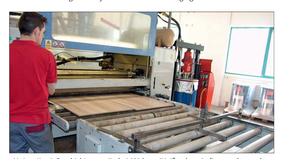
"Hotcoating"-Beschichtung mit drei Walzen (Heißwalze, Auftragswalze und revers laufende Glattwalze)

mie stimmte schnell zwischen den Deutschen und den Spaniern. Beides familiengeführte Unternehmen, genauso wie Lico.