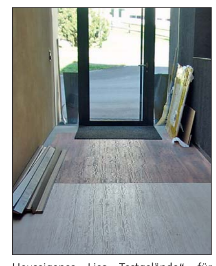
Hauseigenes Lico-"Testgelände" für neue Fußböden