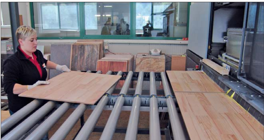
Mit dem Bedrucken von Korkböden hat Lico vor gut sechs Jahren angefangen. Im Bild oben ist die zweite, vor gut einem Jahr installierte Vierfarben-Anlage "Rho 750" von Durst zu sehen. Gefragt sind derzeit vor allem Holzoptiken (unten).

sung von 250 dpi erreicht werden. Das können auch die modernen Singlepass-Anlagen (der neue "Colorizer" von Dieffenbacher verspricht 600 dpi) bieten, trotzdem bleibt Lico dem Multipass und auch Durst treu. Die Erstanlage wird demnächst ersetzt. Eine zweite, eine "Rho 750" wurde bereits vor gut einem Jahr installiert. Unabdingbar für einen guten Druck ist das Auftragen einer weißen Grundierschicht. Bei Lico wird zweimal beschichtet, bevor die Werkstücke bedruckt werden. Gedruckt wird, was gefällt. Standardmäßig hat Lico etwa den Smarties-, den Rosen- oder den Flaschenkork-Boden im Programm. Etwas extravaganter ist da schon der Wunsch eines Kunden nach einem Stacheldraht-Boden.