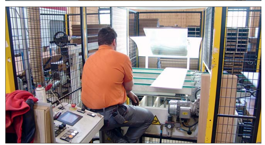
Viele Augen und viele Hände sind bei der LVT-Produktion gefragt. Das händische Auflegen ist den Linggs wichtig, um hier noch einmal zwei Augenpaare mehr in der Qualitätskontrolle zu haben. Nach dem Verpressen müssen die Platten drei bis vier Stunden reifen, damit sich die entstandene Schüsselung wieder zurückbildet. Danach erst geht es in den Doppelendprofiler. Dort sind vier Überwachungskameras installiert. Der Höhenversatz wird wieder händisch kontrolliert. Maximal 2/100 mm sind erlaubt.