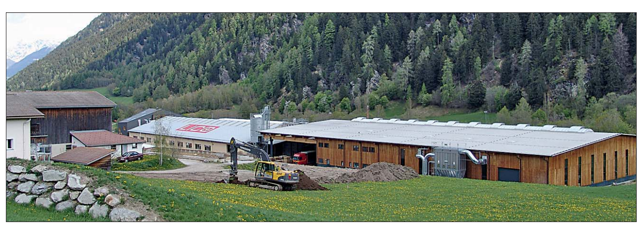
Rund 40 000 m<sup>2</sup> Fläche steht Lico in Müstair zur Verfügung. Zum Zeitpunkt des Besuchs Anfang Mai wurde gerade der Grundaushub für eine neue Lagerhalle realisiert. Nur einen Steinwurf entfernt von dem Gebäude befindet sich der Firmensitz des Beschlagherstellers Hoppe (nicht im Bild). Lico heizt mit Pellets und Briketts aus eigener Fertigung.

Das passt Alfred und Edwin Lingg sehr gut ins Konzept. Denn es ruhen schon wieder die nächsten Ideen in der Schublade, weitere schwirren in den Köpfen herum. Man wird noch viel (Gutes) hören von Lico in der Zukunft; und von Kleiberit; und von Barberán – eine wahrlich erfolgreiche europäische Allianz mit den besten Zutaten aus der Schweiz, Spanien, Italien und Deutschland.