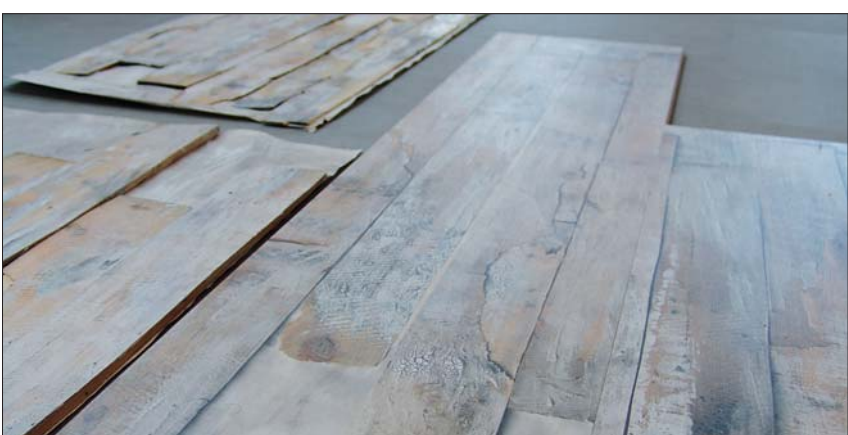
Beim "Printcork" ist erlaubt, was gefällt. Von der Rosen- über die Smarties- bis zur Stacheldrahtoptik (Bild oben). Die Vorlagen werden dabei häufig direkt der Realität entnommen. Wie etwa bei dieser Dielenoptik im Used-Look. Die Vorlage (Bild unten, links) hat Lico digital einscannen lassen. Die Ideen dafür kommen vom Kunden oder die Südtiroler entwickeln eigene Entwürfe.